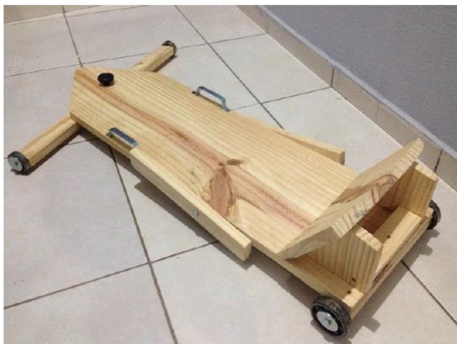
Exemplo de carrinho

13.2. As equipes classificadas em 1 o e 2 o lugar na modalidade de velocidade (prova de descida) receberão um troféu e medalhas para todos participantes das duas equipes e em 1 o na categoria Design e Criatividade, também receberão um troféu.